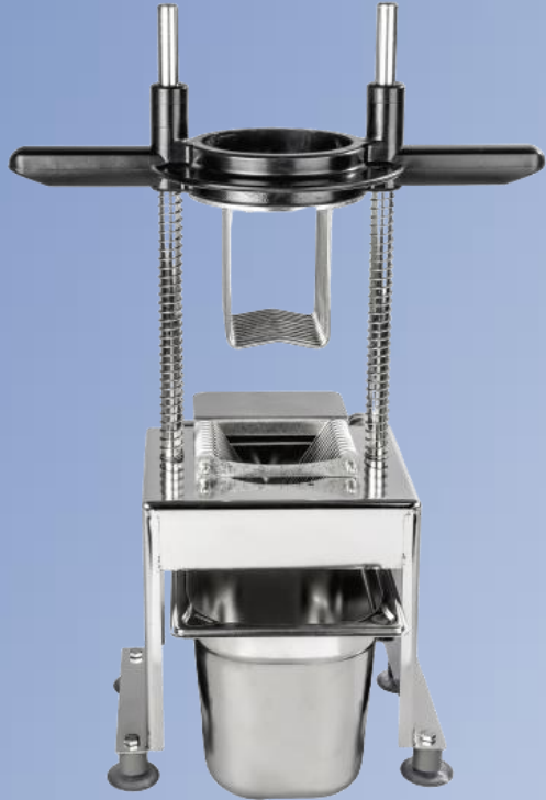
Combi sekač KKS 1-3 – seče voće i povrće na više oblika