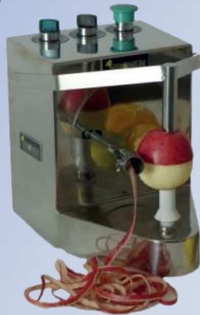
Piler za jabuku