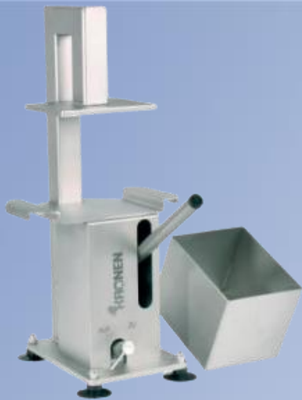
Za otvaranje kokosovog oraha