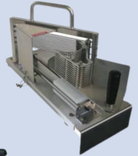
Slajser za paradajz