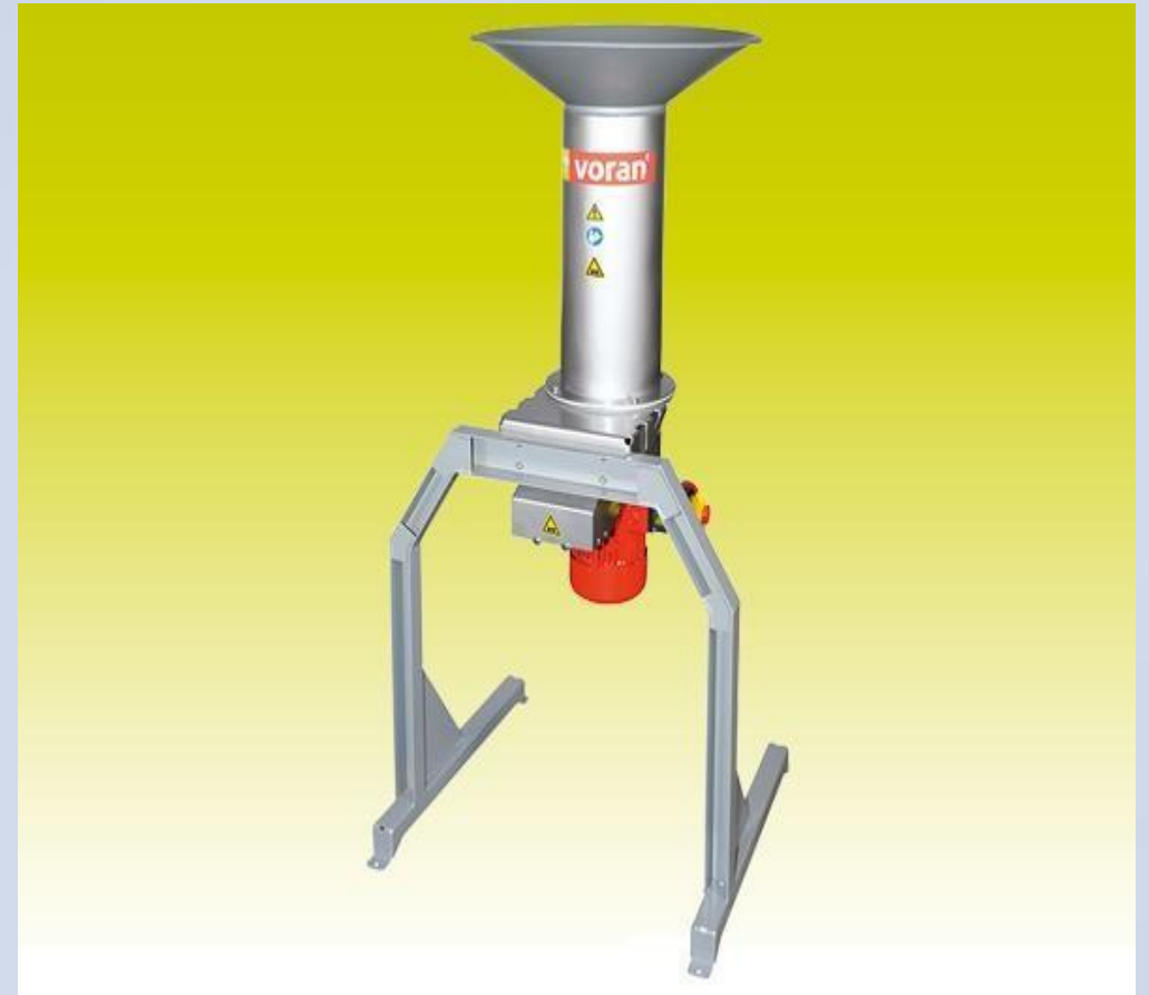
TIP MLINA RM1,5