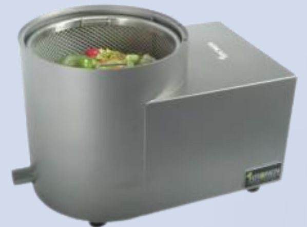
Centrifugalni sušač za povrće