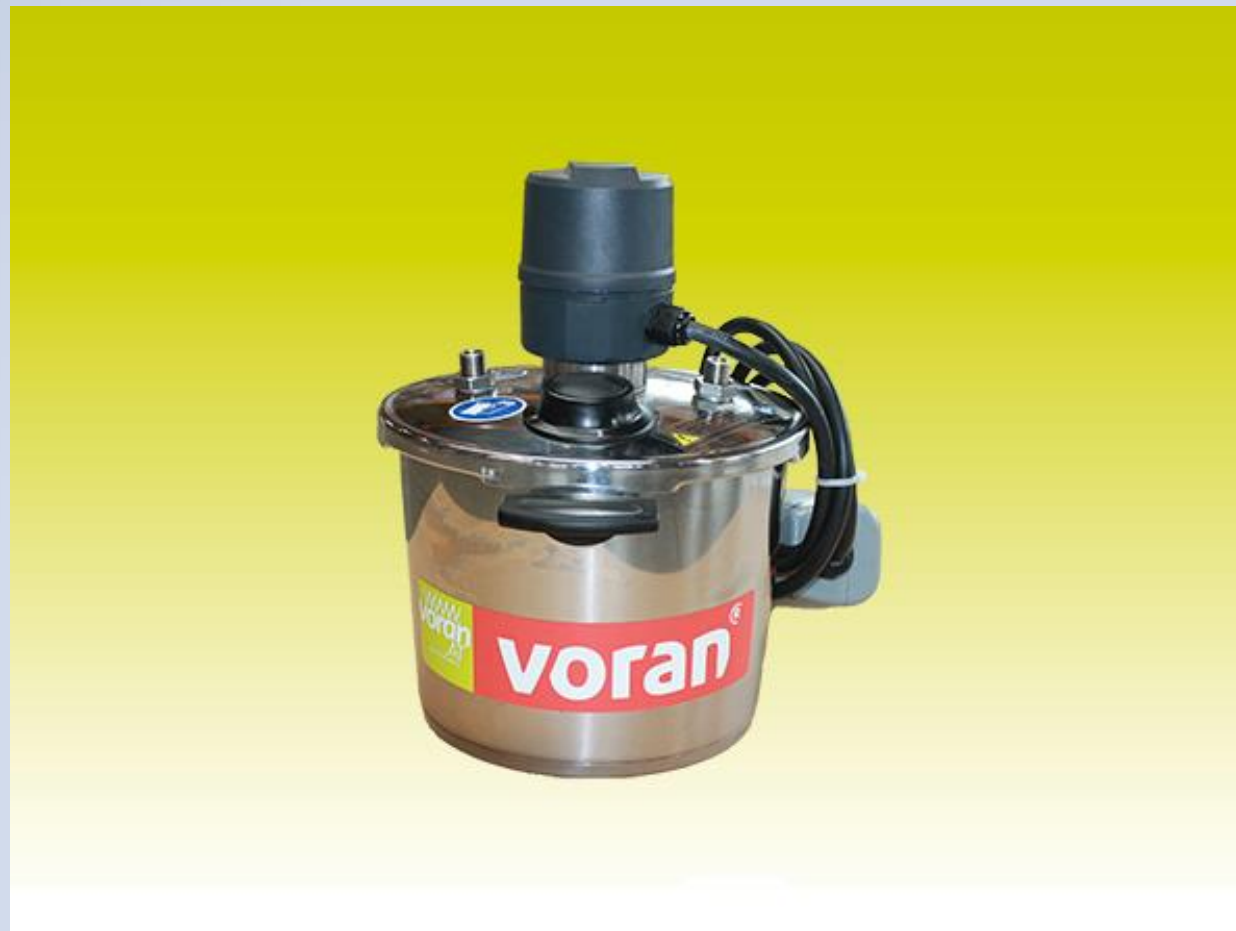
Pasterizator PA90 električni