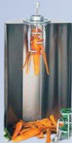
Ljuštilica za šargarepu i krastavac