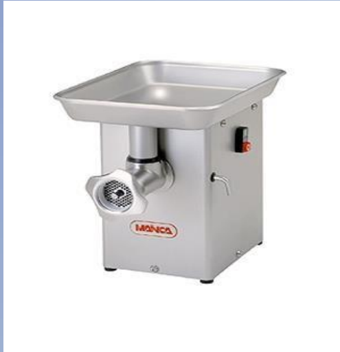
PM-70 / PM-12