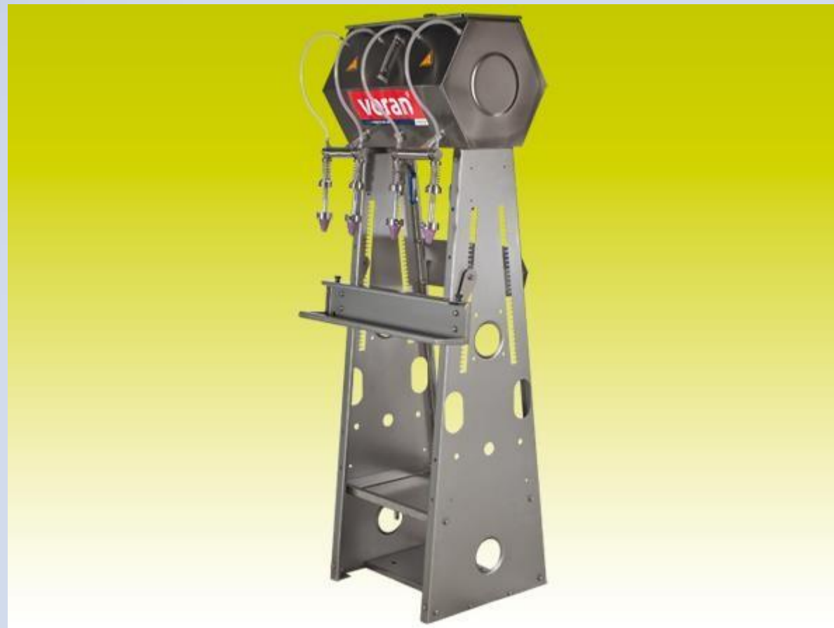
Punilica sa 4 filera

Služe za punjenje boca od 0,25 - 5 l vrućim voćem i sokovima, pomoću filtera napravljenih od nerđajućeg čelika. U ponudi su punilice sa 4 ili 6 pozicija za punjenje.