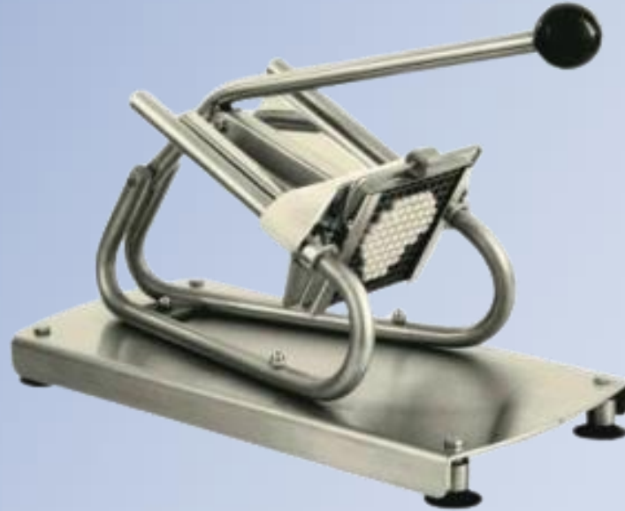
Stick sekač – seče povrće na štapiće