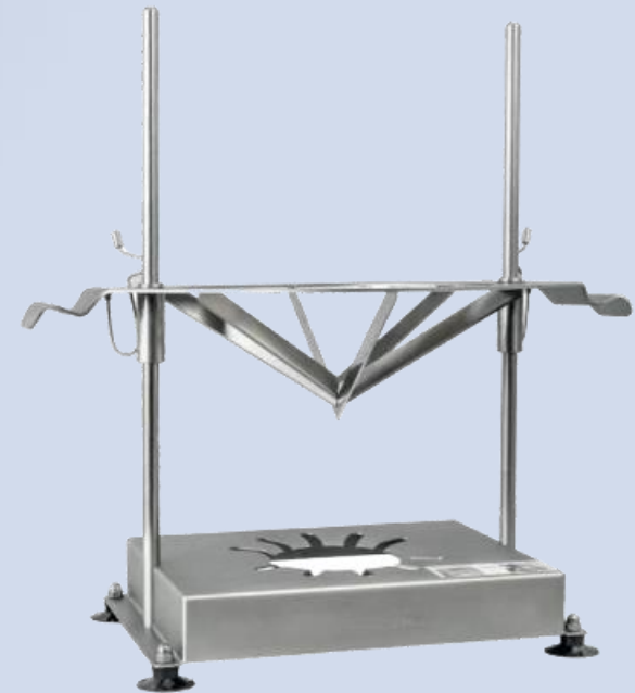
Za sečenje lubenice